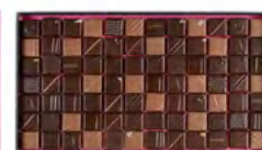
Boite de 920 g : 110,40 € (84 chocolats)