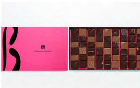
Boite de 600 g : 61,20 € (54 chocolats)