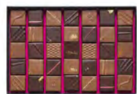
Boite de 370 g : 44,40 € (35 chocolats)