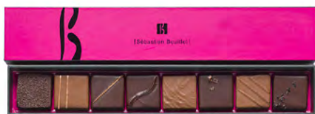
Réglette de 8 chocolats : 9,60 €

Découvrez notre gamme de bonbons chocolat croquants, fondants ou fruités... ganache au poivre de Madagascar, pure origine ou parfumée, praliné maison à l'amande ou à la noisette, rien n'est laissé au hasard. Le sucré, les parfums & les textures sont au coeur de notre réflexion pour provoquer, dans une explosion harmonieuse de saveurs, une expérience gustative unique.