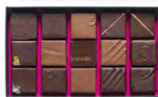
Boite de 160 g : 19,20 € (15 chocolats)