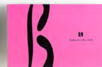
Boite de 260 g : 31,20 € (24 chocolats)